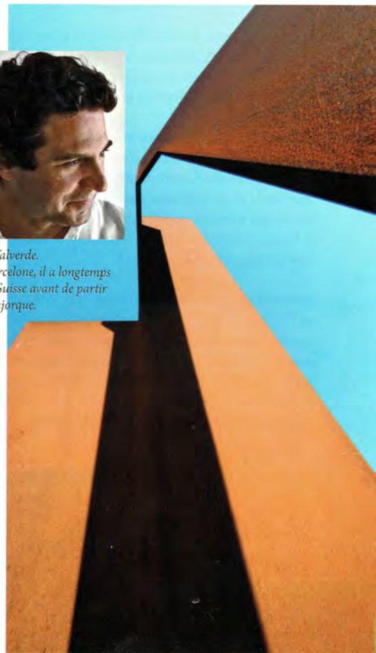
Carles Valverde, Autoroute , Lluçmajor, Majorque, 2005, acier et corten. Hauteur: 9 m. Poids: 10 tonnes.